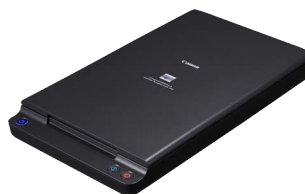
Unidad de escaneo plana 102

Con conexión USB, estos escáneres planos se integran perfectamente con el DR-M260 para crear una solución de escaneo doble que permite aplicar las mismas funciones de mejora de imagen en cualquier trabajo.